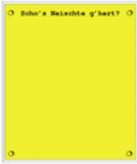
Abbildung: Reproduktion eines Originaldokuments. Copyright © 2013. Alle Rechte vorbehalten. Dieses Dokument ist urheberrechtlich geschützt. Die Reproduktion dieses Dokuments ist ohne schriftliche Genehmigung des Verlegers nicht zulässig.