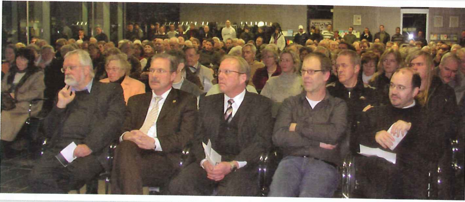
Überkonfessioneller Gebetsabend im Bürgerforum Lüdenscheid