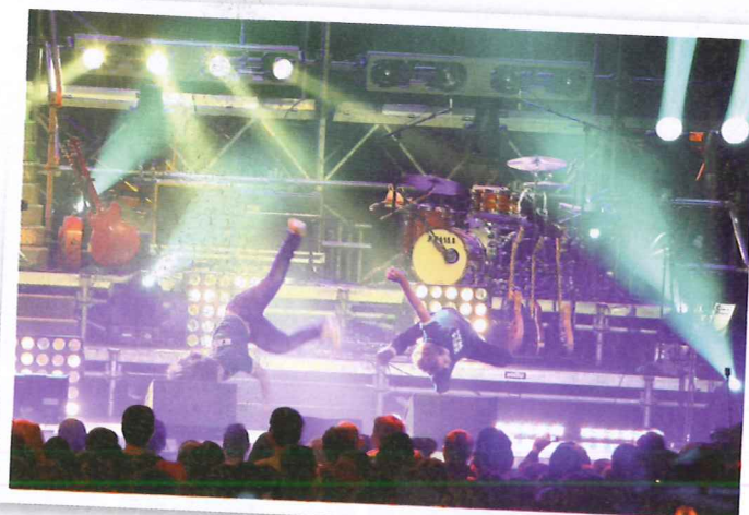
Artistische Einlage der blu:boks-Kids