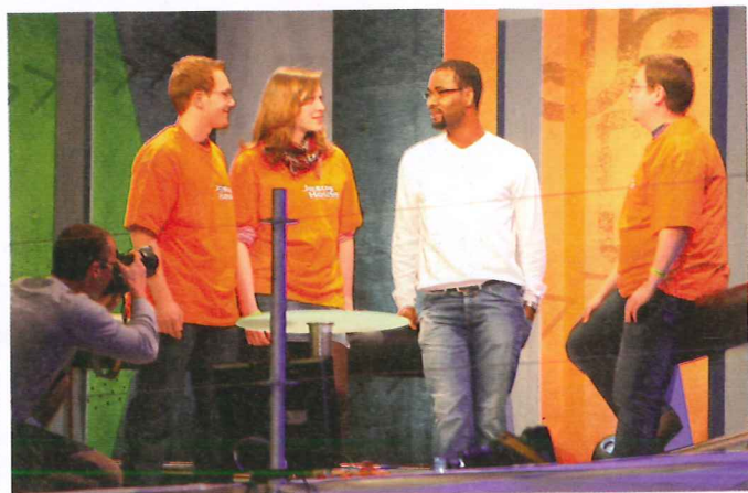
Fußballprofi Cacau (2. v. r.) im Interview