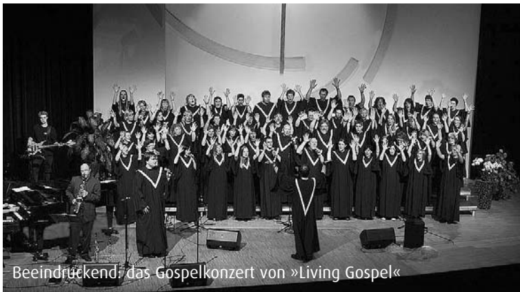
Beeindruckend: das Gospelkonzert von »Living Gospel«

in erster Linie ein bequemes Leben sei uns verheißen, sondern die Ewigkeit bei unserem Vater im Himmel ist uns zugesagt. Eine Hüpfburg war der Magnet für die Kinder.