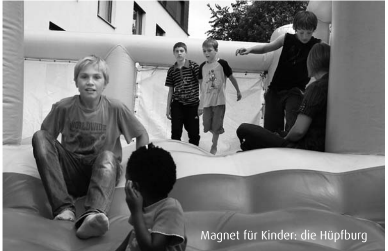
Magnet für Kinder: die Hüpfburg