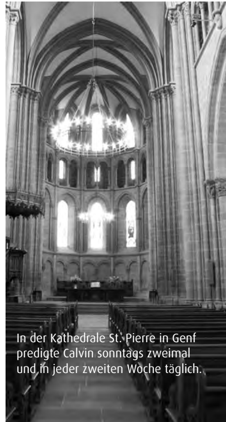
In der Kathedrale St. Pierre in Genf predigte Calvin sonntags zweimal und in jeder zweiten Woche täglich.

Studienassistent am Albrecht-Bengel-Haus