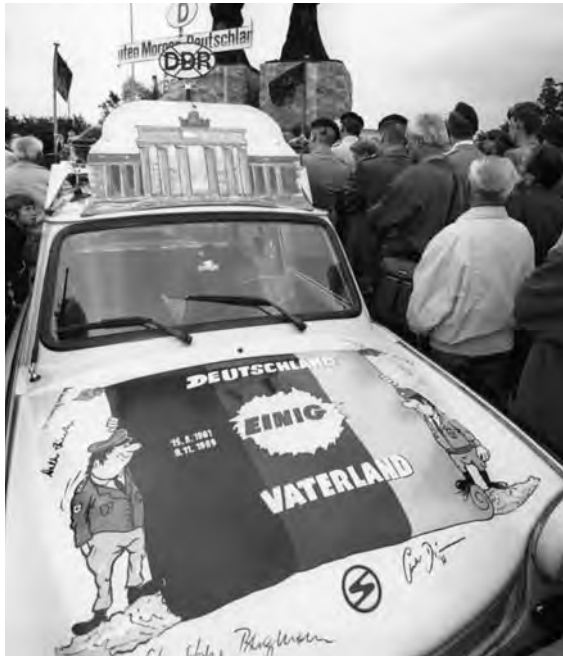
1989: Symbol der werdenden deutschen Einheit: der Trabi, der zur Legende gewordene Kleinwagen der VEB Sachsenring Automobilwerke Zwickau.

Seit den 60er-Jahren reiste ich fast jedes Jahr mit meiner Frau zu Besuchen bei einzelnen Familien und auch zu Ost-West-Begegnungen mit Gruppen in die DDR. Zu Beginn der 80er-Jahre war ich erstmals als Vertreter des Landesbrüderrates des Altpietistischen Gemeinschaftsverbandes (AGV) zur Landesgemeinschaftskonferenz des Sächsischen Gemeinschaftsverbandes nach Karl-Marx-Stadt (Chem-