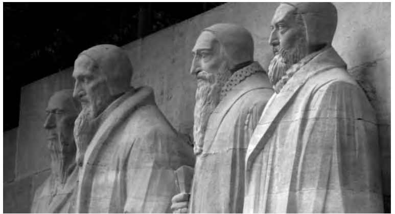
Das Reformationsdenkmal in Genf zeigt von links nach rechts: Guillaume Farel, Johannes Calvin, Theodor Beza und John Knox.