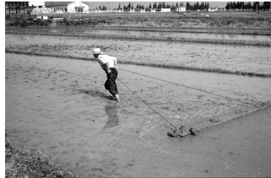
Beides ist China: archaisches Mühlen ...

Niemand kann aber die Zahl der Christen benennen, die sich in den nicht registrierten Hauskirchen treffen. Weil diese Gemeinden weitgehend im Untergrund arbeiten, haben sie nach