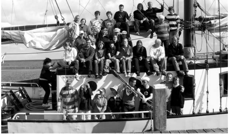
Auf der »Mars« und im sicheren Hafen: Mann- und Frauschaft der Segelfreizeit in Holland

Einmal wurde es spannend: Das Schiff saß auf einer Sand-