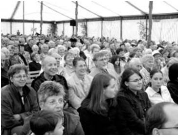
Über 1 000 Gäste beim Festgottesdienst

Jahresfest an Christi Himmelfahrt auf dem Schönblick