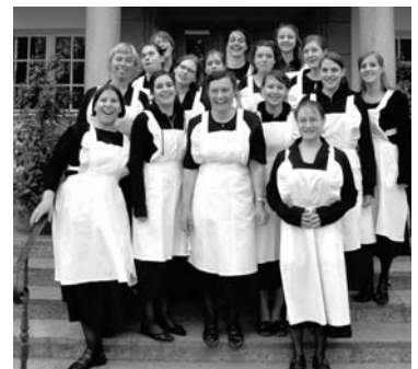
Das heutige Hauswirtschaftsteam wie vor 90 Jahren