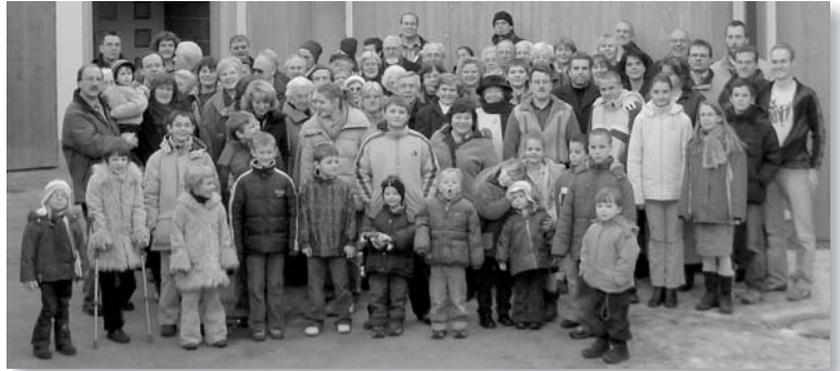
Ein Teil der Tuttlinger Gemeinschaftsbesucher nach einem gemeinsamen Mittagessen.

Neben den nötigen Finanzen wurden viele Ideen, Diskussionen und Arbeitszeit eingebracht. Und das war nicht immer so einfach. Unterschiedliche Temperamente und