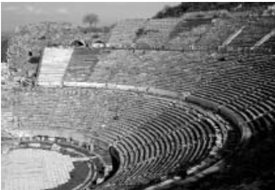
Das Theater in Ephesus fasst auf 66 Rängen etwa 25 000 Zuschauer – ein günstiger Ort für Bürgerversammlungen.

Demetrius war Zuhörer der Predigt des Paulus und zitiert hier Inhalte seiner Verkündigung. Er bestätigt, dass Gott in Ephesus eine Erweckung schenkte und viele zum Glauben kamen.