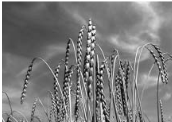
Schöpfungsgemäß? – Weizen, der als Brotgetreide dient ...

Auch ökologisch gibt es starke Argumente für das Verheizen: Angesichts der Debatte um Treibhauseffekt und Klimawandel könnte man das »Heizen vom Acker« als Teil-Ausweg aus der durch fossile Energienutzung zu befürchtenden Klimakatastrophe betrachten.