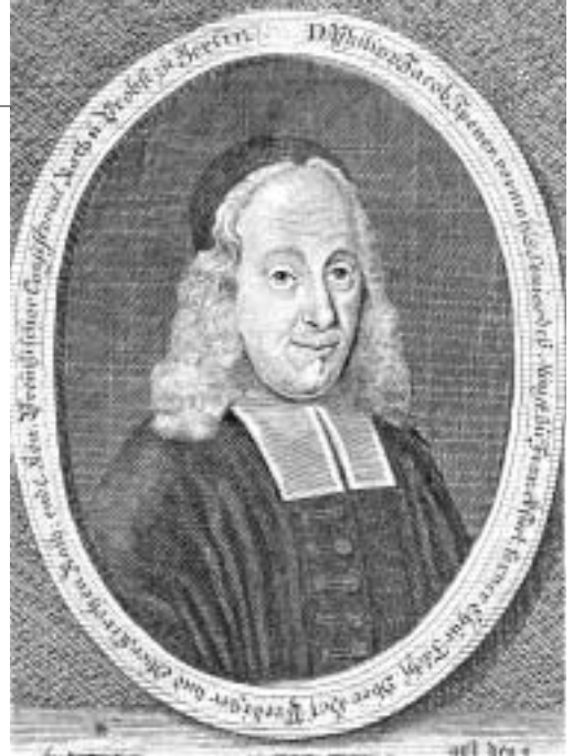
Philipp Jakob Spener (1635–1705)