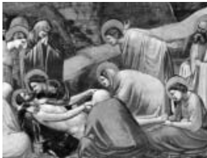
Jesus wurde wahrer Mensch – nie deutlicher als bei seinem Tod