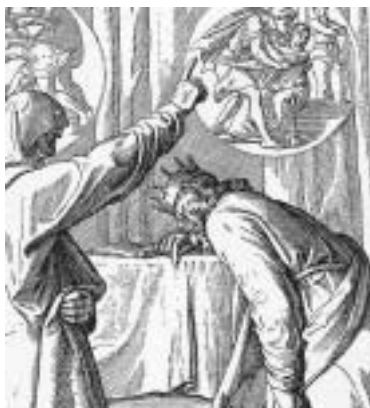
Alle biblischen Vorbilder sind Sünder, die auf Vergebung angewiesen sind, etwa David.

Vorbilder muss man kapiieren, nicht kopieren.